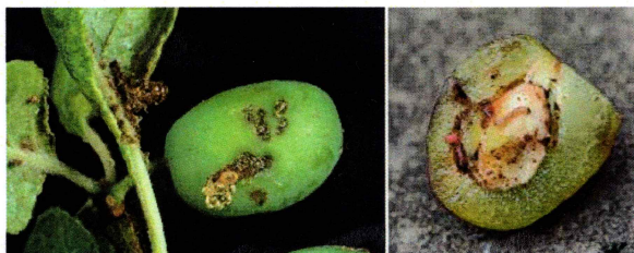
atac de Laspeyresia f.

Adultul este un fluturas cu deschizătura aripilor de 1,4 - 1,56 cm. Aripile anterioare sunt brun-închis, cu pete de culoare mai deschisă spre centru și spre varf. Aripile posterioare sunt brun-deschis spre centru și prevăzute cu franjuri de culoare cenușiu deschis.