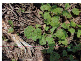
atac de purici